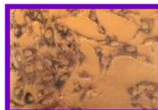
Aktywność mitochondrialna komórek SIRC, oceniona po 48-godzinnym wzroście w teście MTT